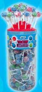
Lotalollies Par 150