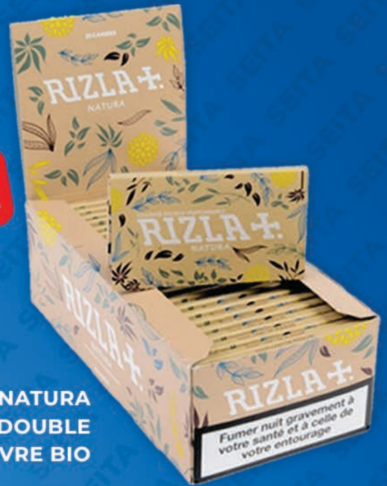
RIZLA NATURA DOUBLE CHANVRE BIO