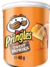
PAPRIKA par 12