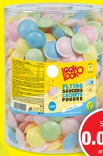
TUBO 500 SOUCOUPES FRUITS par 1 à 11 CHT pce