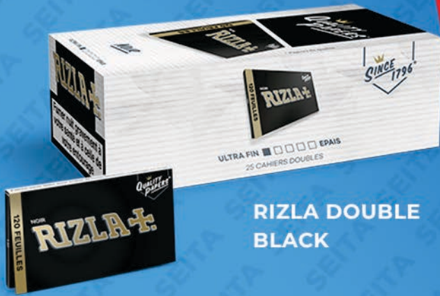
RIZLA DOUBLE BLACK