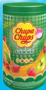
CHUPA CHUPS FRUITS par 100