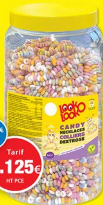
COLLIER LOOK O LOOK par 140