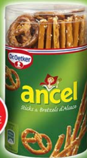
TUBO STICKS BRETZELS 137g par 15