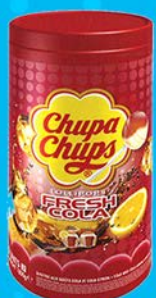
CHUPA CHUPS COLA par 150