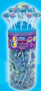
Bi-colors Par 150