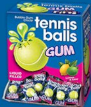
BALLE TENNIS GUM