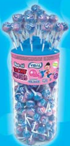
Tache langue Too Ti Par 150