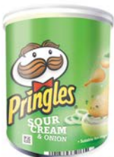
CRÈME & OIGNONS par 12