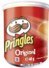
ORIGINAL par 12