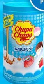
CHUPA CHUPS LAIT par 100