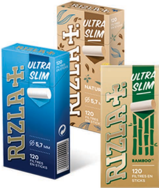
STICKS RIZLA SLIM STICKS RIZLA NATURA STICKS RIZLA BAMBOO