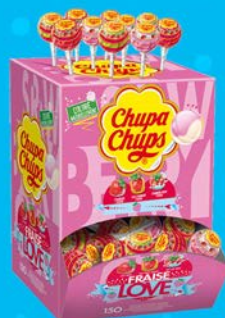
CHUPA CHUPS FRAISE LOVE par 150