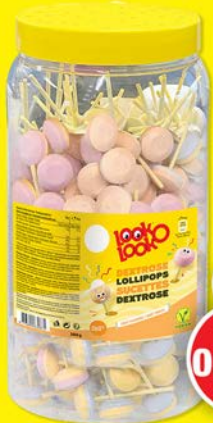
SUCETTE LOLLIES LOL par 260