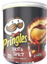
HOT & SPICY par 12