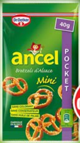
SACHET MINI BRETZELS 40g par 10