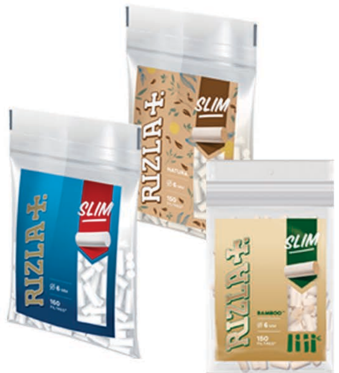
SACHET RIZLA SLIM SACHET RIZLA NATURA SACHET RIZLA BAMBOO

3 BOÎTES DE STICKS ACHETÉES = 100 SACHETS FILTRES