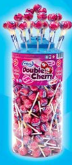
Double effet Cherry Par 150