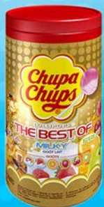
CHUPA CHUPS BEST OF FRUITS par 150