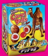
BOULE CHAMEAU GUM