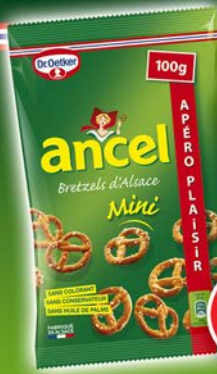
SACHET MINI BRETZELS 100g par 10