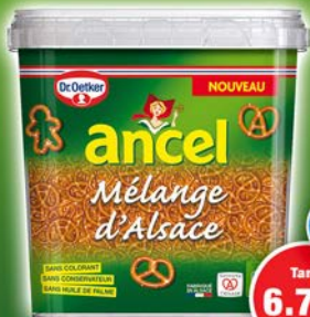
SEAU 1.2kg MELANGE ALSACIENg par 1