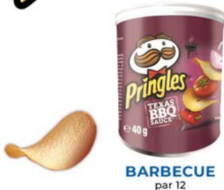
BARBECUE par 12