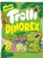
48 SACHETS DINO REX 100g