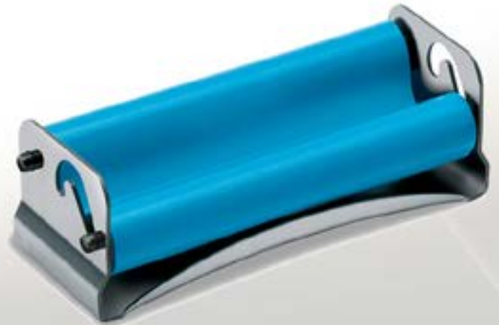
ROULEUR RIZLA Boîte de 10