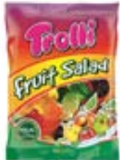
60 SACHETS SALADE FRUITS 100g