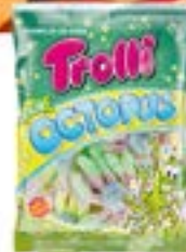
36 SACHETS OCTOPUS 100g