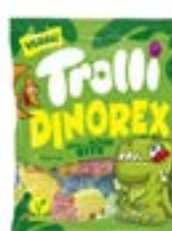
24 SACHETS DINO REX 100g