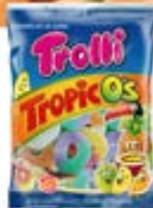
36 SACHETS TROPIC'OS 100g