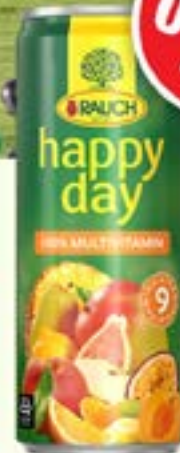
MULTI 33cl Code 01678 par 24