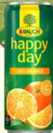
ORANGE 33cl Code 01677 par 24