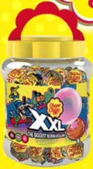
CHUPA CHUPS XXL Code 02681 par 60