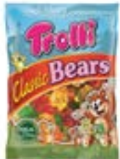
60 SACHETS CLASSIC BEARS 100g