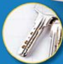
Clés de sécurité à trous