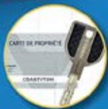
Clés de haute sécurité avec carte de propriété