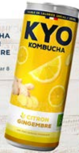
KYO KOMBUCHA CITRON GINGEMBRE 33cl Code 22702 par 6