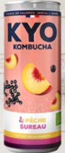
KYO KOMBUCHA PECHE BAIE DE SUREAU 33cl Code 22704 par 6