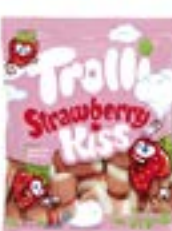
22 SACHETS KISS 100g