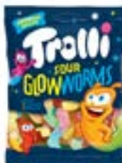
24 SACHETS SOUR CLOWWORMS 100g