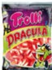
36 SACHETS DRACULA 100g