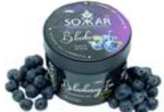
BLUEBERRY ICE Code 49011 par 1 MYRTILLE