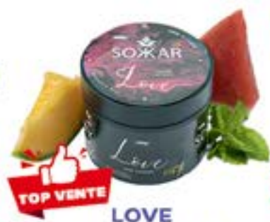
LOVE Code 49002 par 1 MELON / PASTÈQUE MENTHE / PASSION / MIEL