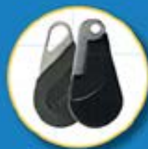
Badges Vigik d'immeubles