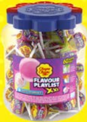
CHUPA CHUPS XXL PLAYLIST Code 02682 par 60