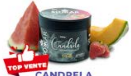
CANDRELA Code 49007 par 1 PASTÈQUE / MELON