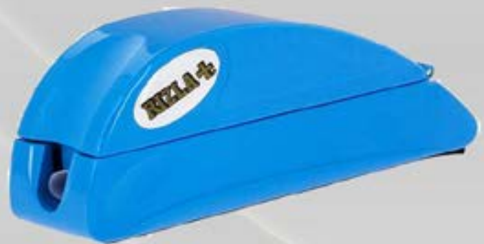
MACHINE TUBE Boîte de 10