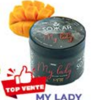
MY LADY Code 49003 par 1 COCKTAIL MANGUE