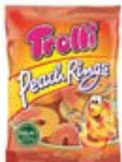
60 SACHETS PEACH RINGS 100g