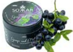
RAISIN MENTHE Code 49012 par 1