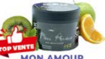
MON AMOUR Code 49009 par 1 TUTTI FRUITY MELON / ORANGE / MENTHE