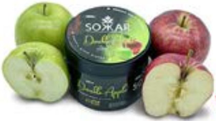
DOUBLE POMME Code 49004 par 1