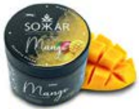
MANGO Code 49010 par 1 MANGUE