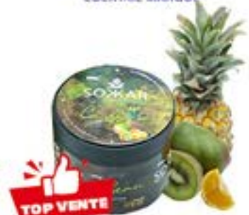
CARIBBEAN Code 49006 par 1 COCKTAIL ANANAS