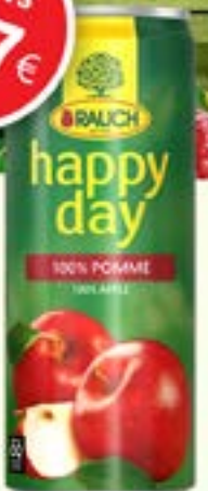
POMME 33cl Code 01679 par 24