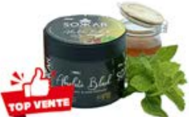
ABSOLUTE BLACK Code 49005 par 1 MENTHE / MIEL