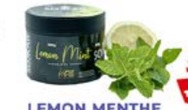
LEMON MENTHE Code 49008 par 1 MENTHE / CITRON (MOJITO)