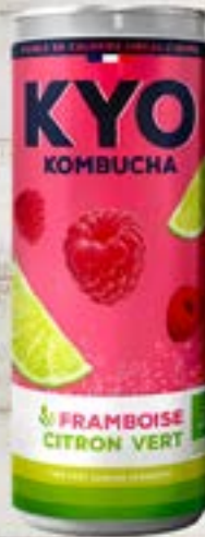
KYO KOMBUCHA FRAMBOISE CITRON VERT 33cl Code 22703 par 6