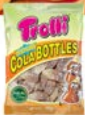
60 SACHETS SOUR COLA BOTTLES 100g