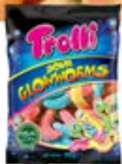
60 SACHETS SOUR CLOWWORMS 100g