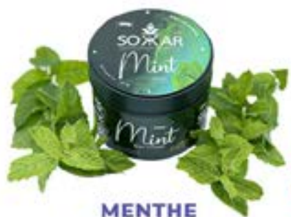
MENTHE Code 49001 par 1